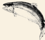
Skotsk Atlanterhavs Laks