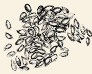
Britisk Dyrket Høfrø