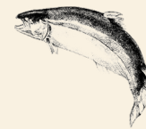
Skotsk Atlanterhavs Laks