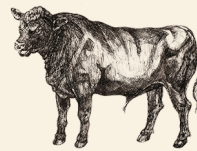
Aberdeen Angus Okse