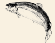
Skotsk Atlanterhavs Laks