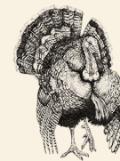
Norfolk Black Kalkun